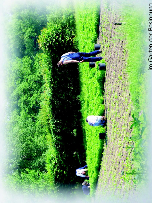
im Garten der Besinnung

Das an christlichen Grundwerten orientierte Behandlungskonzept bietet die Möglichkeit Fragen nach dem Lebenssinn und dem persönlichen Glauben mit einzubeziehen.